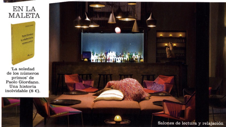
Salones de lectura y relajación

'La soledad de los números primos' de Paolo Giordano. Una historia inolvidable (8 €).